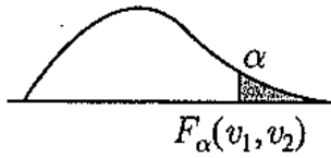
附表三：F 分配右尾百分點 F_{\alpha}(v_1, v_2)